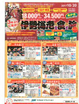
びゅう旅行商品パンフレット

JR 東日本の首都圏エリアの主な駅にあるびゅうプラザまたは びゅう予約センター0570-04-8928 (携帯・PHS・IP 電話・ひかり電話からは、03-3843-2001)にて 発売いたします。