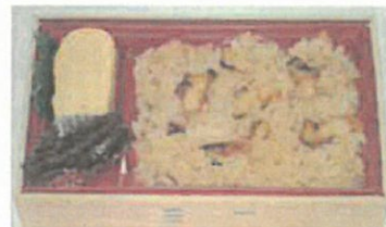
1日目昼食 さざえご飯弁当