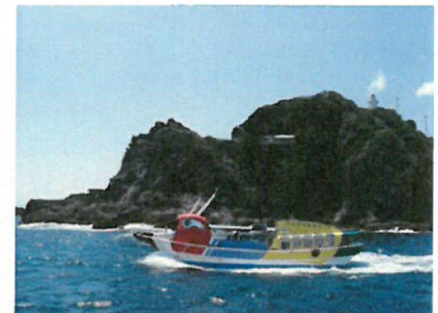
石廊崎岬めぐり遊覧船